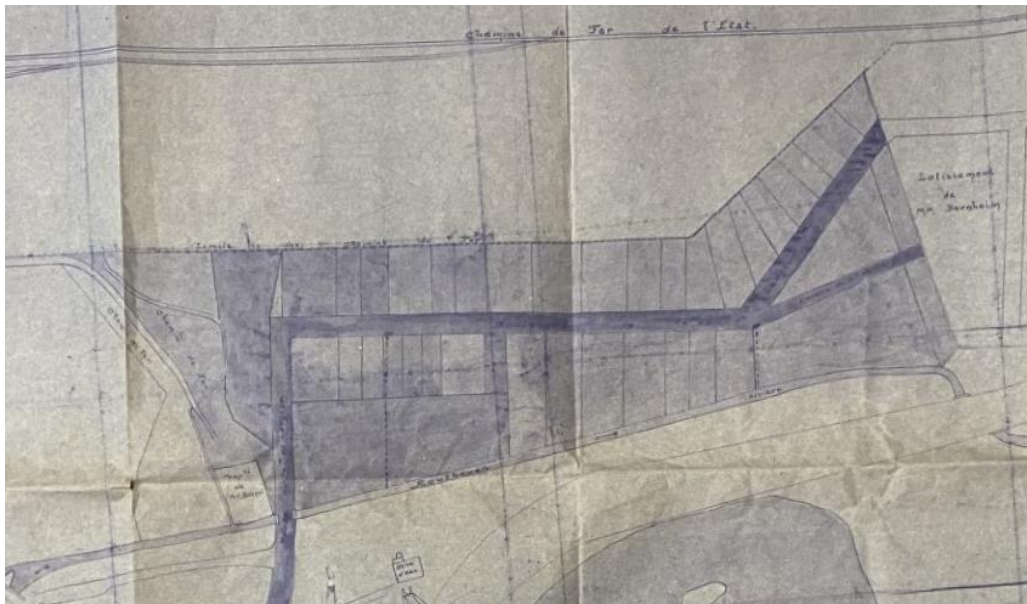
(plan de lotissement annexé à l'arrêté du 1 er mars 1926 , pièce n°3 )

Par arrêté du Préfet d'Ille-et-Vilaine du 1 er mars 1926, le lotissement créé par les Consorts Létang a été approuvé ( pièce n°2 ).